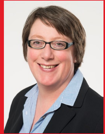
Silke Gardlo | Vorsitzende der SPD-Regionsfraktion

Aber auch für die Schülerinnen und Schüler wird es mit der Einführung einer „Ganzjahres-Netzkarte“, die künftig im gesamten GVH-Tarifgebiet gilt und auch in den Sommerferien gültig sein soll, eine deutliche, spürbare Verbesserung geben. Bei einer Umstellung des Systems kommen wir nicht umhin, auch im geringen Umfang Preissteigerungen in Kauf zu nehmen. Das betrifft Kunden, die jetzt Fahrten aus den Zonen „Umland“ oder „Region“ nach „Hannover 2“ unternehmen. Aber überwiegend werden die Preise stabil bleiben (für 61 % der Zeitkartenkunden) oder sogar leicht gesenkt werden können (für 31 % der Zeitkartenkunden).