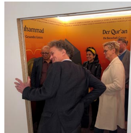
Bei der Besichtigung einer der neun Würfel der multimediaalen Dauerausstellung, die Religionen und Weltanschauungen abbilden.

Zentrum für interreligiöse und interkulturelle Bildung den Dialog zwischen den Religionen und Weltanschauungen.